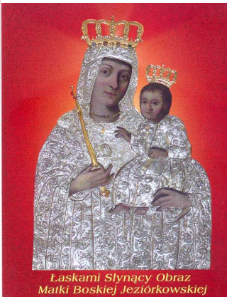
Laskami Słynący Obraz Matki Boskiej Jeziorkowskiej

Dnia 25 września 2008 r. w naszej szkole odbyła się Msza Św. inaugurująca nowy rok szkolny, którą odprawił nasz proboszcz